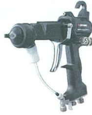
エア静電ハンドガン HB シリーズ