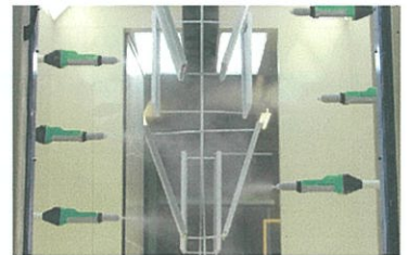
3Dレシプロ塗装風景