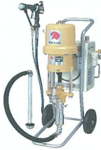
エアラップ静電ガン Te-Top APEG100