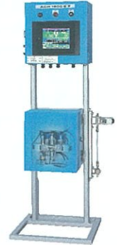
単色用 CNC 二液塗装機 ACW1200EX