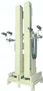
スマートレシプロ