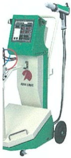
ハンドガン ユニット