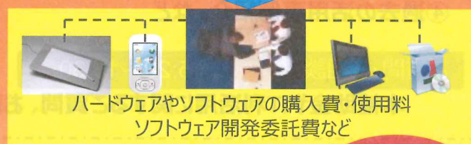
ハードウェアやソフトウェアの購入費・使用料 ソフトウェア開発委託費など