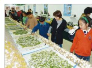
生命産業カキコ生態館