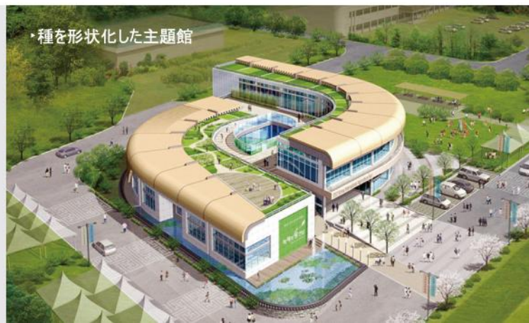
・種を形状化した主題館