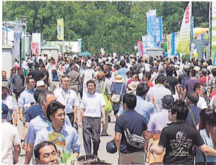
来場者で賑わった会場中央通り