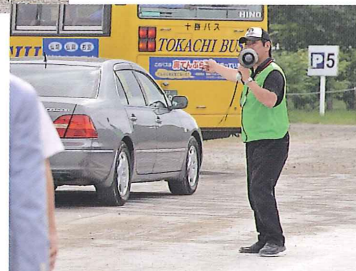
帰りの来場者を誘導するスタッフ