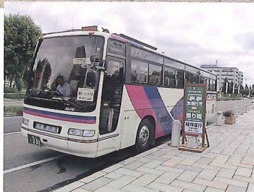
とかちプラザ横のシャトルバス乗り場