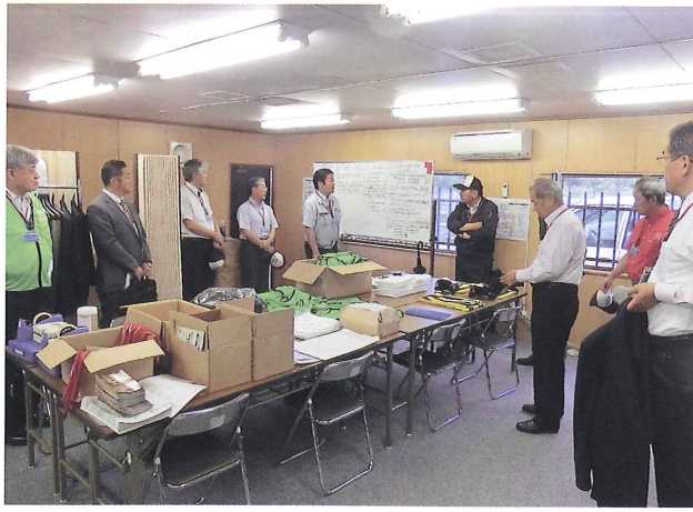
初日の朝、緊張感漂う開会式前の本部