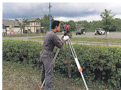
北愛国会場測量作業 (平成26年6月16日)