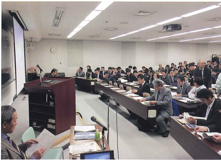
出展社説明会 / とかちプラザ視聴覚室 (平成26年3月13日)