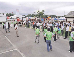
最終日を除く毎日夕方から行われた夕礼