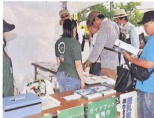
本部横の受付案内テント