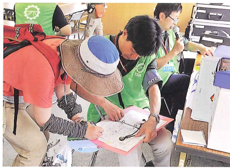
場内のアナウンスは日本語の他に英語専門のスタッフも配置