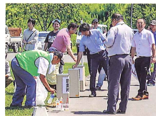
本部横に設置した喫煙所