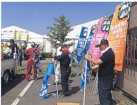
のぼり設置作業 (平成26年7月8日)