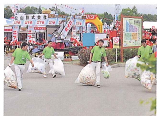
毎日夕方にゴミを収集