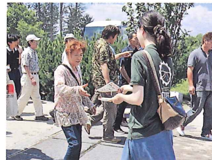
会場パンフレットの配布