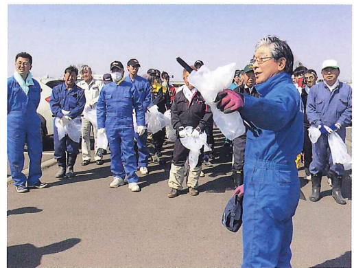
札内川河川敷ゴミ拾い(平成26年4月24日)