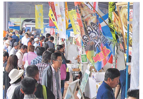
約50店舗が軒を連ねた食彩祭