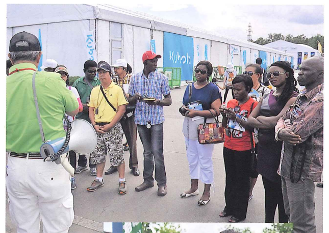
海外からのお客様、視察団に会場を説明