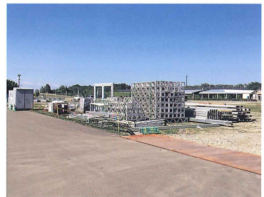
北愛国会場ブース用資材搬入 (平成26年6月26日)