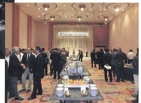
出展社交流会 / ホテルノースランド帯広 (平成26年7月9日)