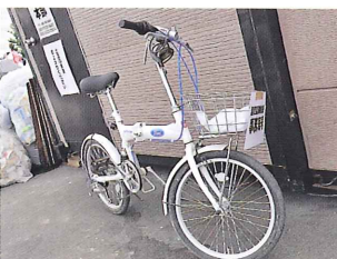
会場内の移動に大いに役立った事務局号