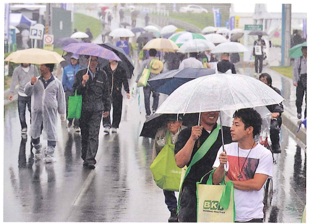
あいにくの雨にもかかわらず初日は多数の来場者を記録