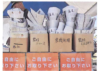
配布された農業関係の新聞