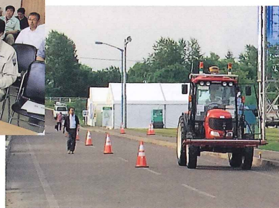
無人トラクターマッピング作業 (平成26年7月7日)