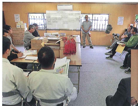
関係企業最終確認 (平成26年7月9日)