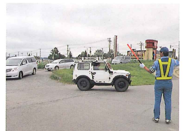
札内川河川敷臨時駐車場入口