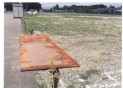
北愛国会場電気工事 (平成26年6月21日)