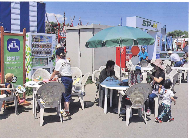
中央通りに設置した休憩所と自動販売機