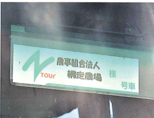
各地から来場した団体客を乗せた貸切バス