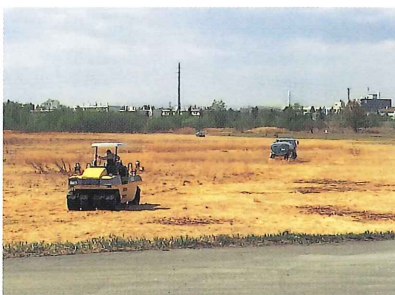
札内川河川敷整備作業 (平成26年4月28日)