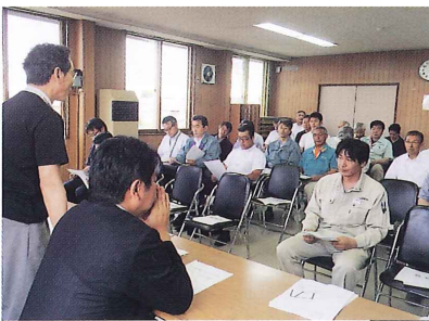
会場部会会議 (平成26年6月30日)